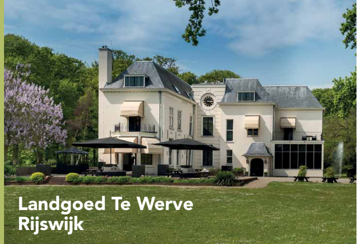
Landgoed Te Werve Rijswijk