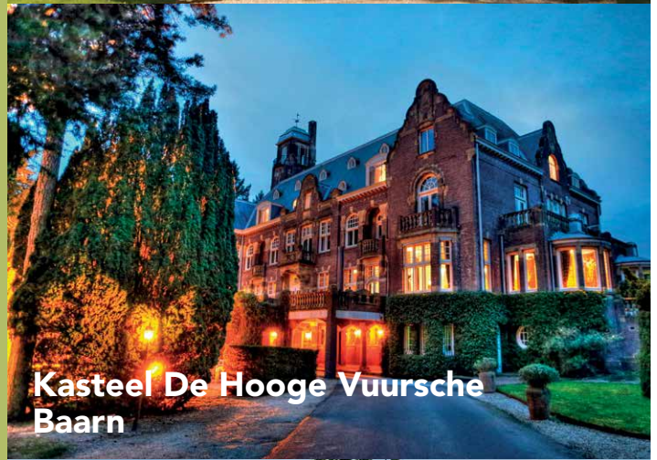
Kasteel De Hooge Vuursche Baarn