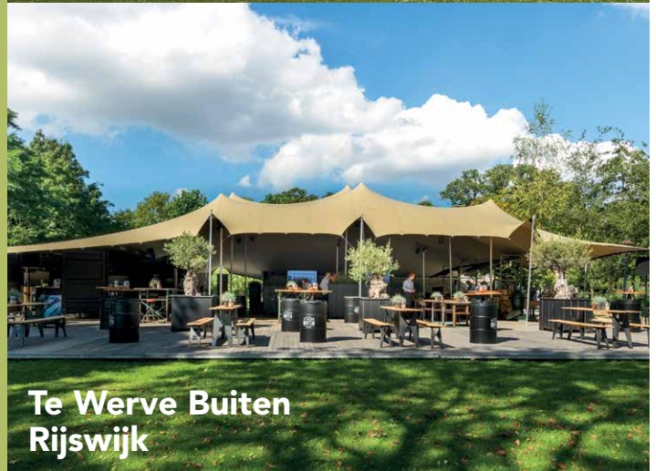
Te Werve Buiten Rijswijk